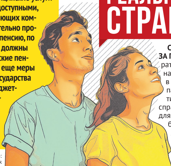
Иллюстрация: разработано Freerik

Как сделать медицинские услуги по-настоящему доступными, а работу управляющих компаний – действительно прозрачной? Какую пенсию, по вашему мнению, должны получать российские пенсионеры и какие еще меры поддержки от государства необходимы бюджетникам, самозанятым, участникам СВО, студентам или семьям с детьми?