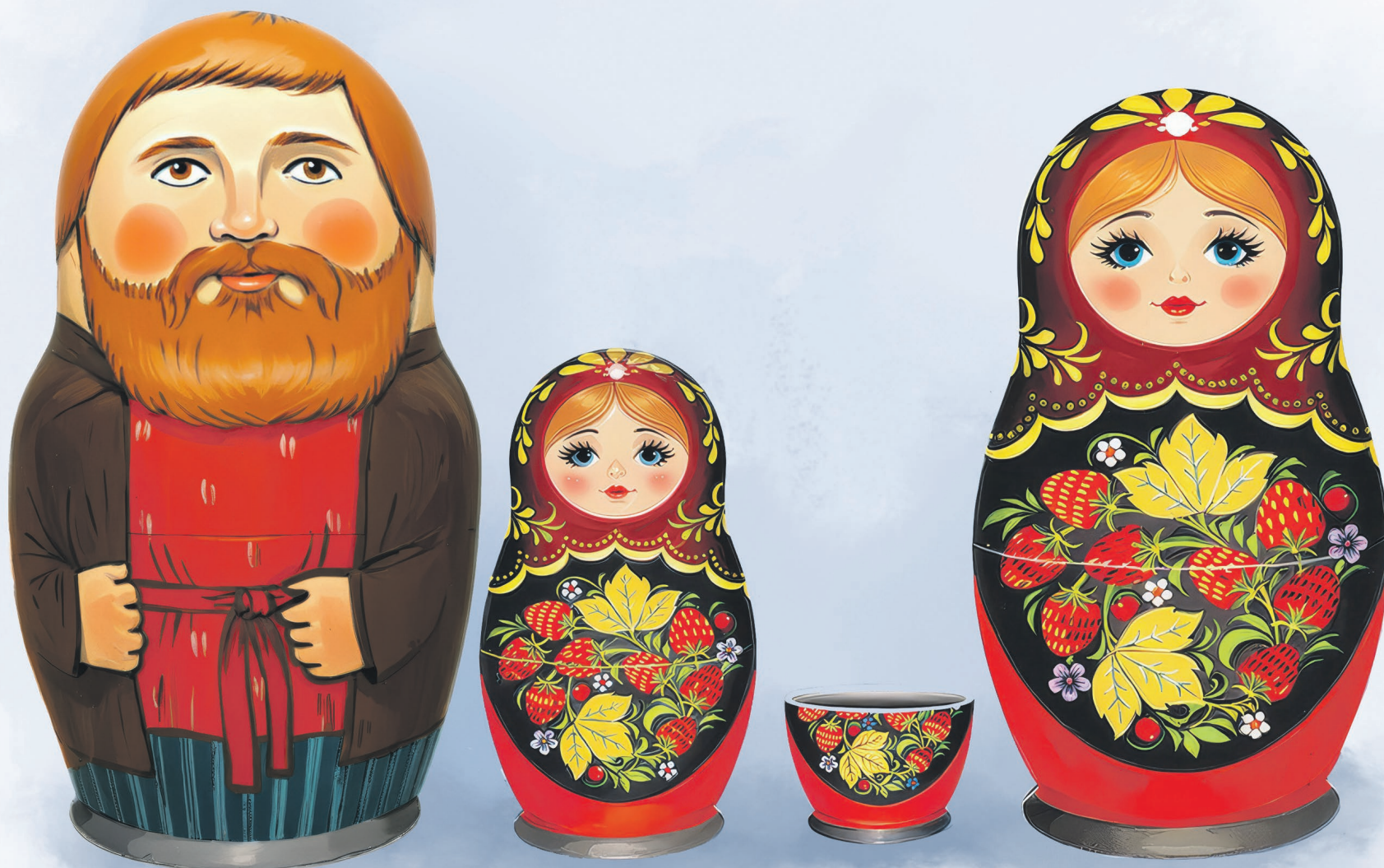
Иллюстрация: Алексей Беленёв

Появление на свет ребенка – это, конечно же, радость. И вместе с тем бесконечные хлопоты: выносить, выкормить, вырастить здоровым, дать образование... Не приятные заботы, а настоящая полоса препятствий в нынешних условиях жизни. Неудивительно, что многие российские семьи рожают одного – максимум двух детей. Есть ли выход из этого тупика?